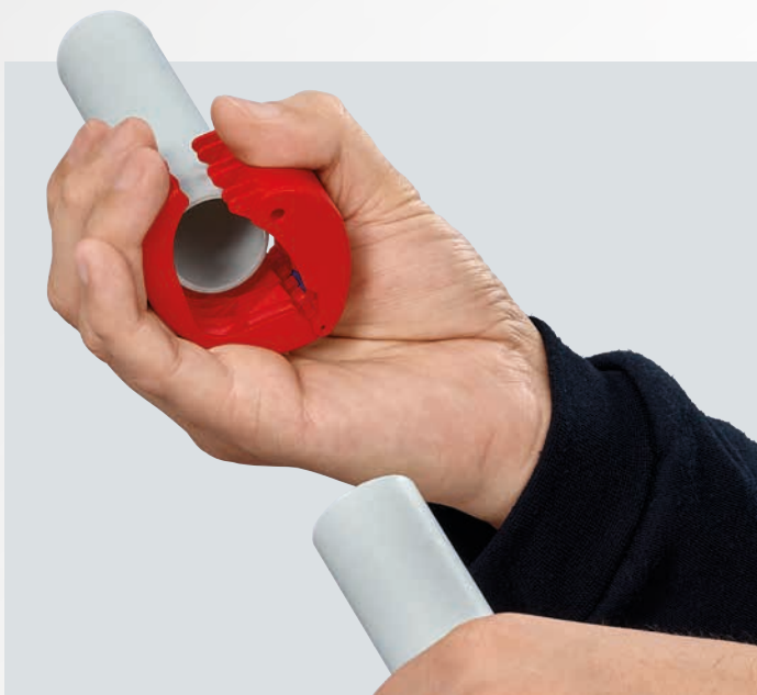
Практично, быстро и чисто: пластиковые трубы можно очень быстро резать, а секции труб надежно удерживаются в инструменте.

Соблюдайте стандарты DIN 18534 при выполнении работ уже сейчас: Водоотводящие и уплотнительные втулки защищают стены от долгосрочного повреждения в результате протечек.