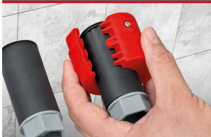
Уникальная конструкция поворотного блока лезвия означает, что водоотводящие и уплотнительные втулки можно надежно отрезать на расстоянии 2–3 мм от стены для безопасного отвода влаги.

Соблюдайте стандарты DIN 18534 при выполнении работ уже сейчас: Водоотводящие и уплотнительные втулки защищают стены от долгосрочного повреждения в результате протечек.