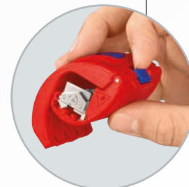
С помощью синей защелки сложенный инструмент KNIPEX ViX® можно безопасно заблокировать для транспортировки.